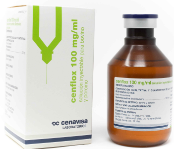
Enrofloxacin 100 mg/ml