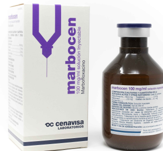
Marbofloxacino 100 mg/ml